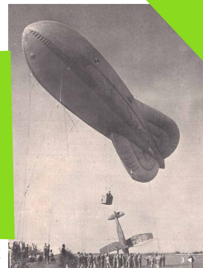
Scéna leteckej katastrofy z filmu „Dievča hľadá lásku“

Čo je zaujímavé, v tomto filme boli predstavené scény leteckej katastrofy, pri ktorej bol použitý model skutočnej veľkosti. Model naplnený výbušninami bol vyneseny do výšky niekoľko stoviek metrov s použitím pozorovacieho balóna. Lietadlo odrezané od balóna následne spadlo na zem a zhorelo. Táto scéna patrí medzi najúchvatnejšie a najdrahšie v histórii poľského predvojnového kina. Pozornosť si zaslúži aj vtedajšia inovácia týkajúca sa charakterizácie filmového hrdinu – Witolda, ktorého zahral Mieczysław Mielecki. Keď ho vykliesnili z vraku lietadla, jeho tvár bola popálená a zakrvavená. Predtým sa krv na plátne neukazovala, možno trochu, keď režisér chcel ukázať, že sa hrdinovi stalo niečo zlé. Bolo to tak kvôli vtedajšej cenzúre kina.