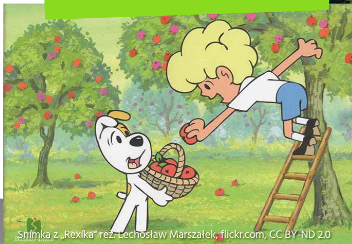
„Snímka z „Rexíka“ rez. Lechosław Marszałek, flickr.com, CC BY-ND 2.0

na vytvorenie približne 100-minútovej animovanej rozprávky „Velké putovanie Bolka a Lolka“ bolo potrebných až 60 tisíc obrázkov?