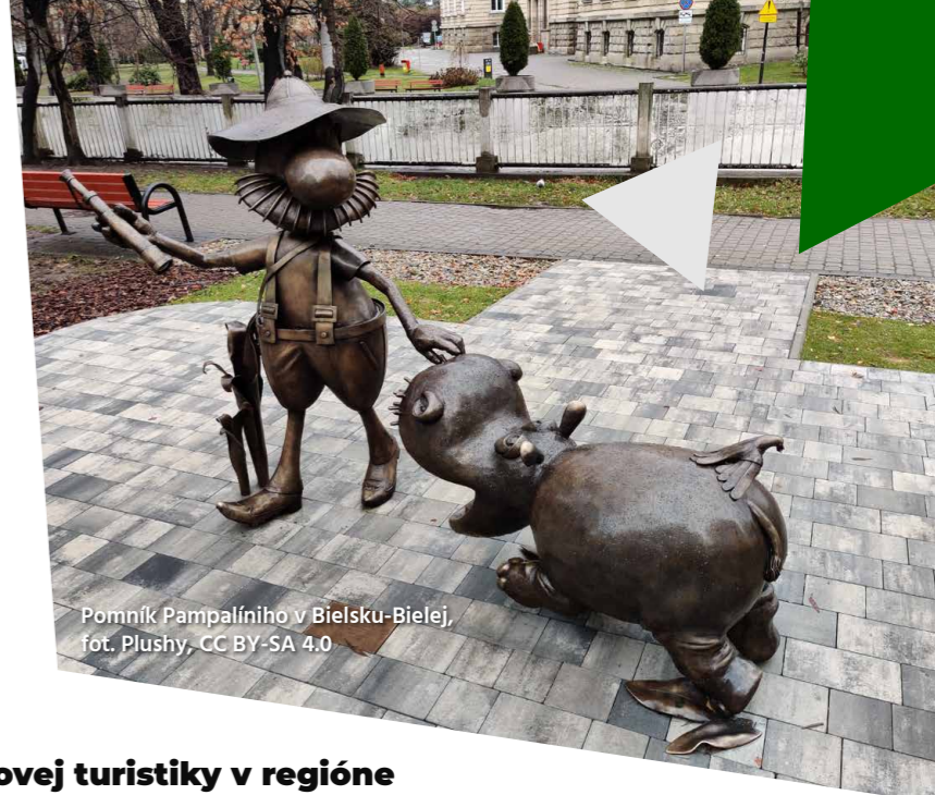
Pomník Pampaliniho v Bielsku-Bialej

V rámci propagácie filmového dedičstva je od roku 2009 vytváraná pešia trasa „Rozprávkové mesto Bielsko-Biala“, na ktorej nechýbajú pomníky filmových postáv: Rexík, Bolek a Lolek, Pampalini lovec zvierat, Wawelský drak a kuchár Bartolini Bartolomej s erbom Zelený petržlen. Pripravuje sa postava Špióna z Krajiny dažďa Dona Pedra de Pommidore v sprievode Mypinga. Bielsko-Biala okrem toho ponúka možnosť skupinovej návštevy miestneho štúdia animovaných filmov. Program je prispôsobený podľa veku účastníkov, nechýba návšteva štúdia, ani predstavenie rôznych animácií v kinosále.