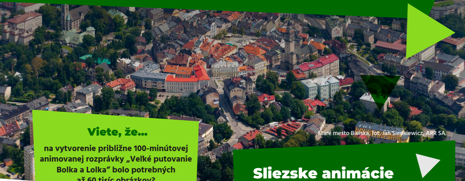
Staré mesto Bielská