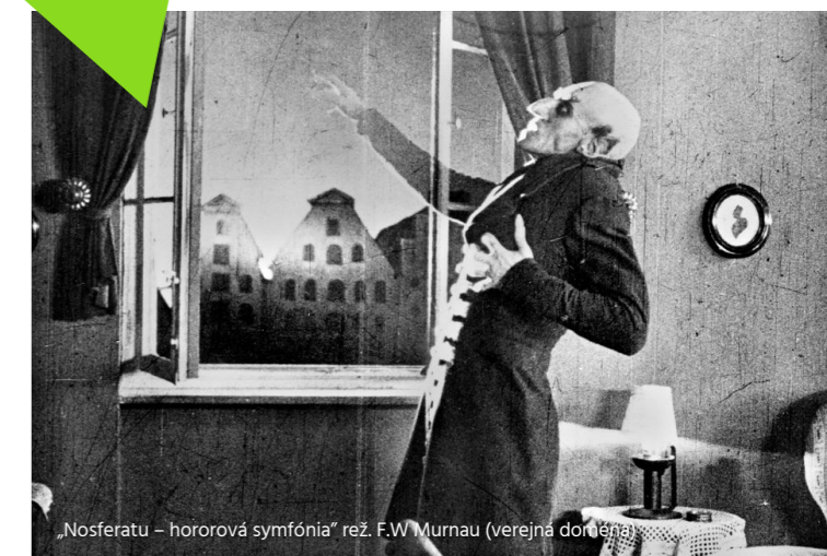
„Nosferatu – hororová symfónia“ rež. F.W. Murnau

Nosferatu – hororová symfónia z roku 1922 režiséra Friedricha Wilhelma Murnaua je najstarším filmom produkovaným v oblasti poľsko-slovenského pohraničia. Ide o prvý významný horor v histórii kín a súčasne archetyp nespočetných ďalších upírskych príbehov. Fotografie k filmu vznikali o. i. v Žilinskom kraji na Slovensku.