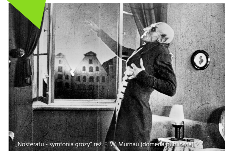
„Nosferatu - symfonia grozy” reż. F. W. Murnau (domena publiczna)

Nosferatu – symfonia grozy z 1922 roku w reżyserii Friedricha Wilhelma Murnaua jest najstarszym filmem produkowanym na obszarze pogranicza polsko-słowackiego. To pierwszy znaczący horror w historii kina i jednocześnie archetyp niezliczonych późniejszych opowieści o wampirach. Zdjęcia do filmu powstawały m.in. w regionie żylińskim na Słowacji.